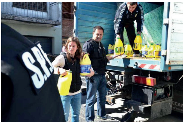
Foto publicada en la página web del Servicio Penitenciario Federal. Fuente: http://www.spf.gov.ar . Consulta: 24/4/13.

Los días siguientes a la inundación del 2 de abril de 2013 en La Plata, el Director del Servicio Penitenciario Federal se hizo presente junto a agentes penitenciarios para repartir lavandina para los damnificados: