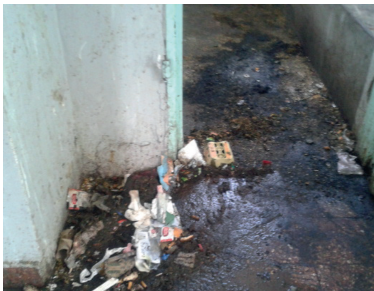
Foto tomada por el GESPyDH el 9 de abril de 2013 en el marco del trabajo de campo en el pabellón 11 de la Unidad 6 de Rawson del SPF.

El Director del SPF fue solidario con la lavandina que debía haber llegado a la Unidad 6 para limpiar los pabellones que muestra esta otra foto (Pabellón 11 Unidad 6 de Rawson, SPF)